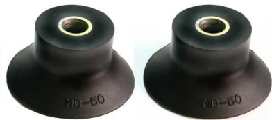
F43-MD 50 / 60